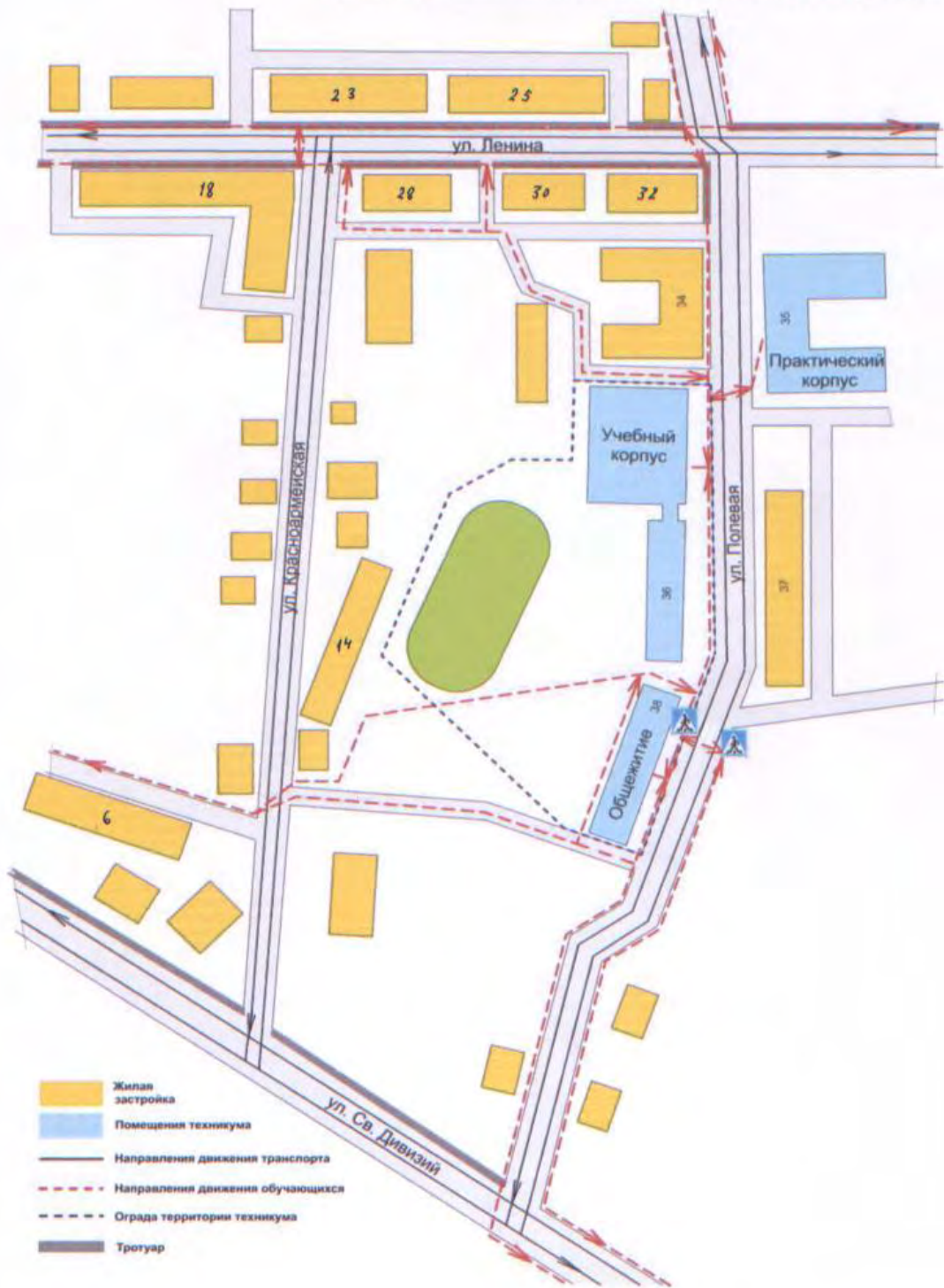
«План-схема расположения техникума, пути движения ТС и обучающихся»